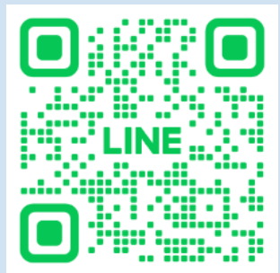
チョイソコていね 公式LINEアカウント 二次元コード