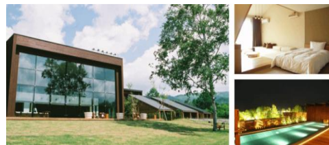
テラス蓼科」（長野県）