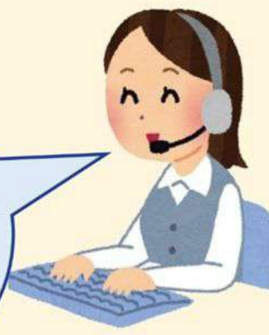
受付オペレーター

予約の際は、例えば、「10時くらいの迎えでJR手稲駅北口に行きたい。買い物が、1時間半くらいで終わるから帰りの分も予約したい」とお伝えください。1回のお電話で往復の予約が出来るのでとても便利です。